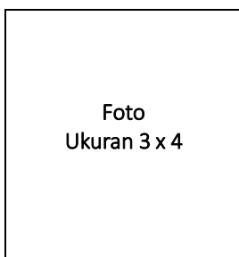
Foto Ukuran 3 x 4

Nomor Test : ..... Nama Lengkap : ..... (Lengkap dgn Gelar) Tempat, Tgl. Lahir : ..... Tempat Pekerjaan : ..... Program Studi : ..... Alamat Rumah : .....