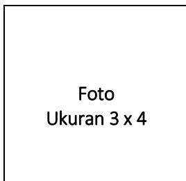
Foto Ukuran 3 x 4

Nomor Test : ..... Nama Lengkap : ..... (Lengkap dgn Gelar) Tempat, Tgl. Lahir : ..... Tempat Pekerjaan : ..... Program Studi : ..... Alamat Rumah : .....